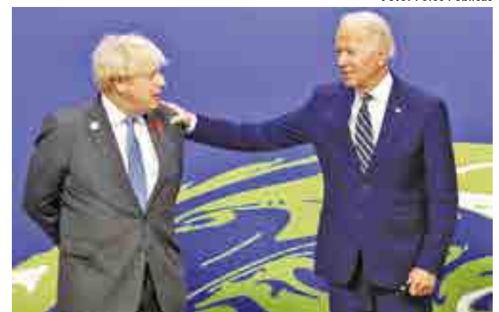
Primeiro-ministro britânico, Boris Johnson, e o presidente dos EUA, Joe Biden

O democrata lembrou que as transformações no clima já estão custando "trilhões de dólares" às economias, mas reiterou que, em meio à "crescente catástrofe", existe uma oportunidade para assegurar a matriz energética e representar um "chamado à ação".