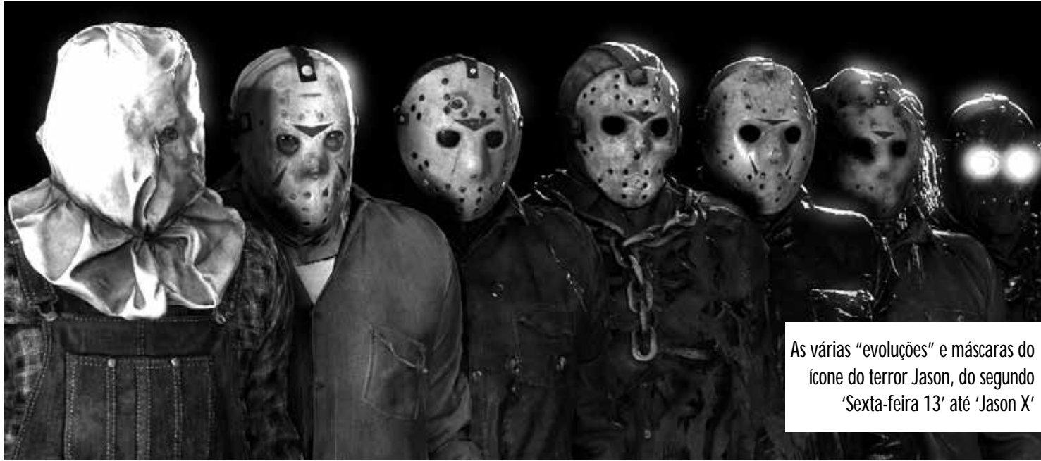
As várias "evoluções" e máscaras do ícone do terror Jason, do segundo 'Sexta-feira 13' até 'Jason X'