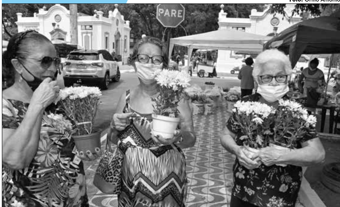
Homenagem aos mortos

SECRETARIA DE ESTADO DA COMUNICAÇÃO INSTITUCIONAL EMPRESA PARAIBANA DE COMUNICAÇÃO S.A.