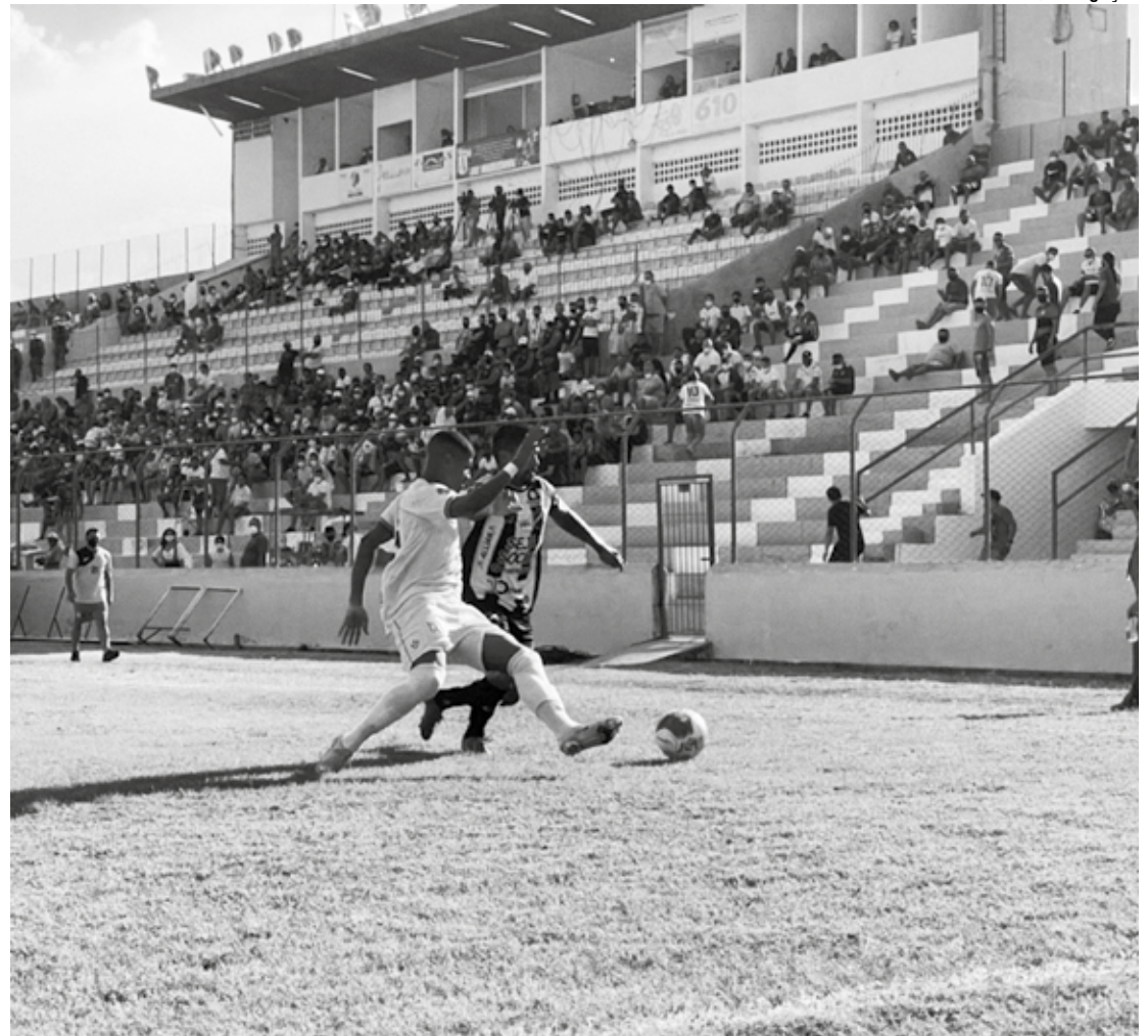
Os estádios e ginásios onde acontecerão os eventos terão que apresentar uma adequada circulação natural de ar