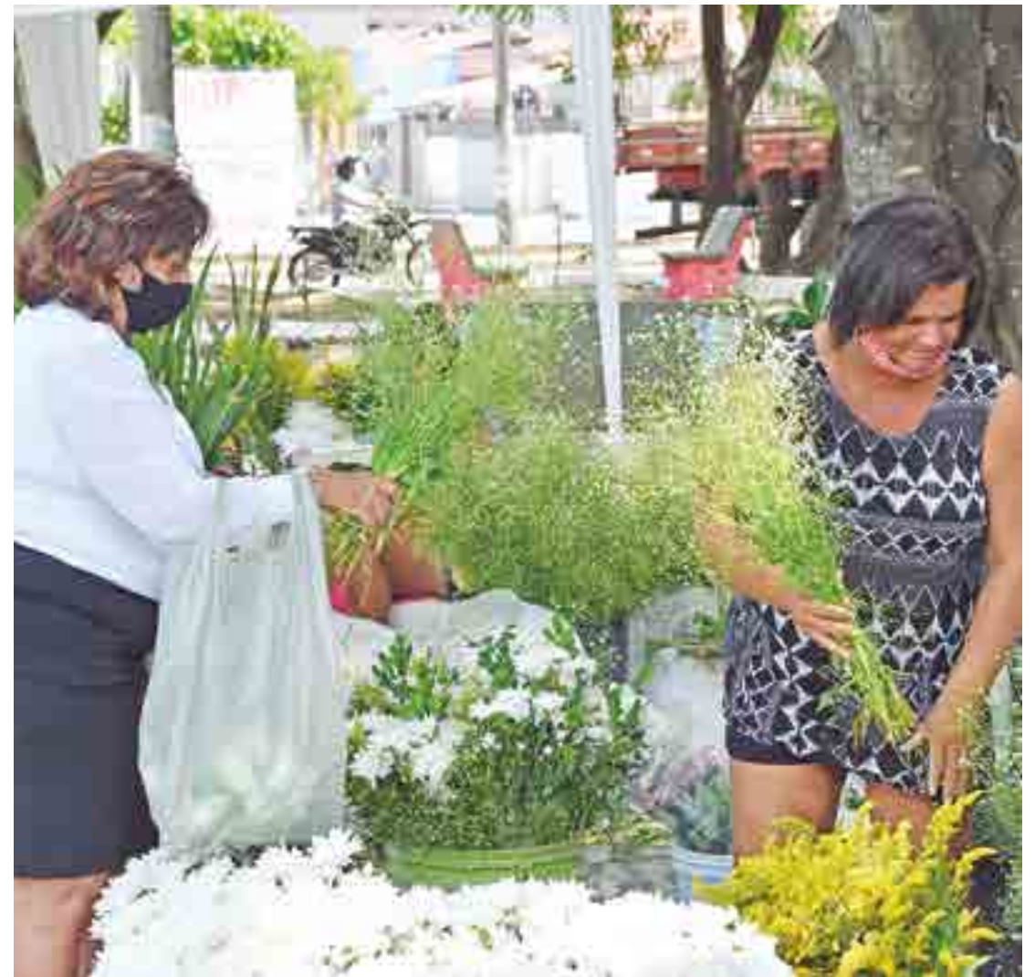
A movimentação intensa levou os comerciantes instalados nas portas dos cemitérios a faturar bem na véspera de finados

O que se verificou no dia de ontem no Cemitério Senhor da Boa Sentença foi que muitas famílias decidiram contratar trabalhadores para que fosse feita a limpeza dos túmulos.