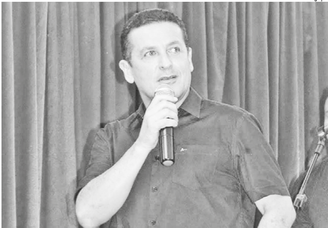
Iponax Vila Nova irá apresentar o especial sobre o 15º festival Estado Contra Estado no canal da Funesc, no Youtube