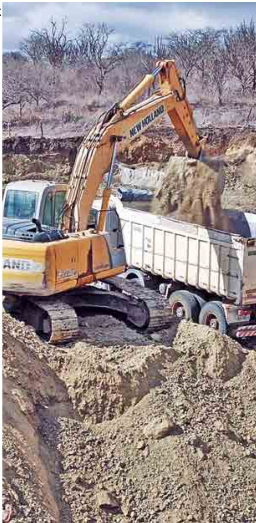
Estado é rico em minerais para construção civil, além de argila para cerâmica vermelha

Com foco na ampliação da atividade de exploração dos minérios na Paraíba, a cidade de Soledade lançou o projeto do Polo Industrial de Mineração. A iniciativa baseia-se nos resultados obtidos no setor durante o primeiro semestre deste ano, cujo faturamento no país cresceu 98%, passando de R$ 75,3 bilhões (registrados entre janeiro e junho de 2020) para R$ 149 bilhões, segundo o Instituto Brasileiro de Mineração (Ibram).